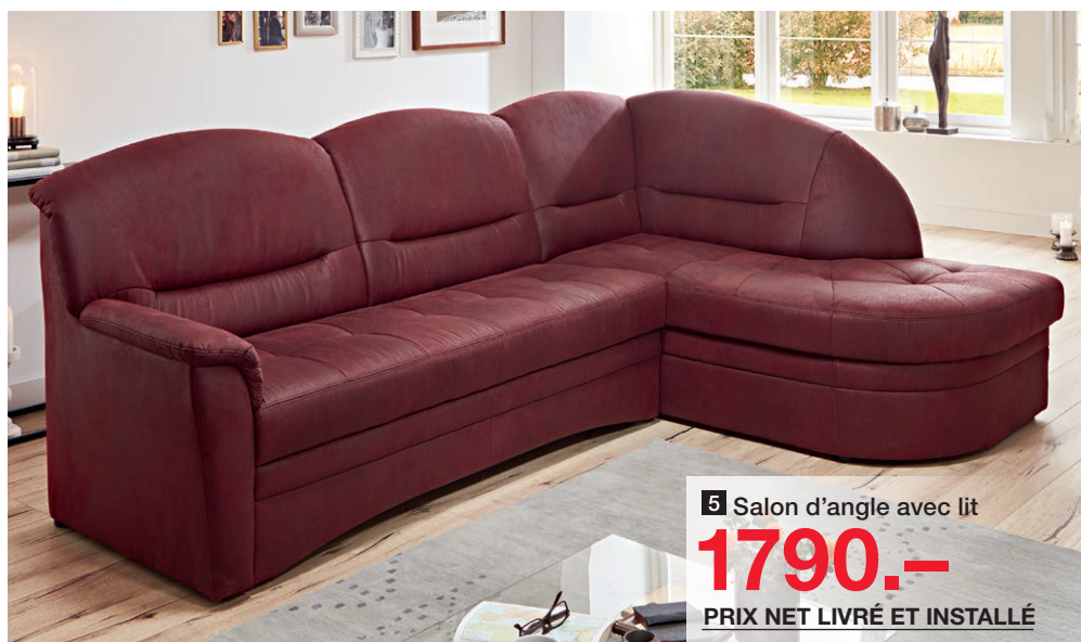
5 Salon d'angle avec lit