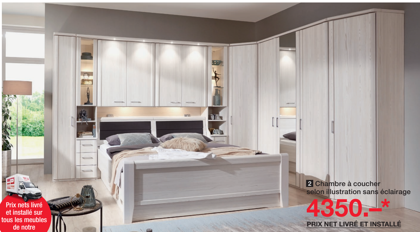
2 Chambre à coucher selon illustration sans éclairage