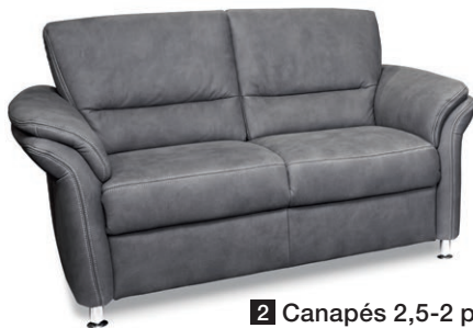
2 Canapés 2,5-2 places en tissu

Prix nets livré et installé sur tous les meubles de notre prospectus