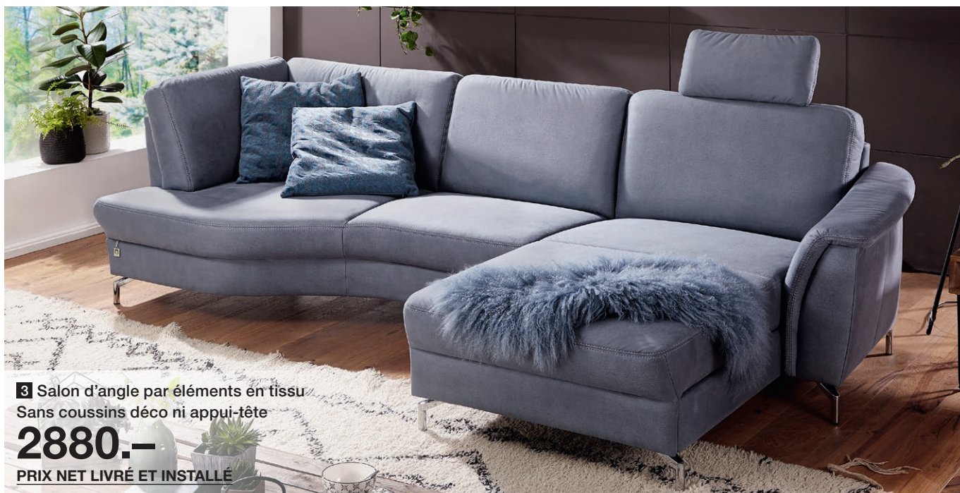
3 Salon d'angle par éléments en tissu Sans coussins déco ni appui-tête