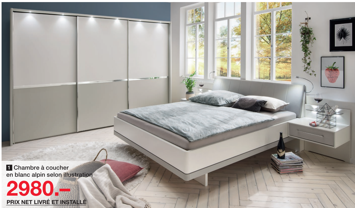
1 Chambre à coucher en blanc alpin selon illustration