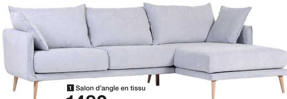
1 Salon d'angle en tissu