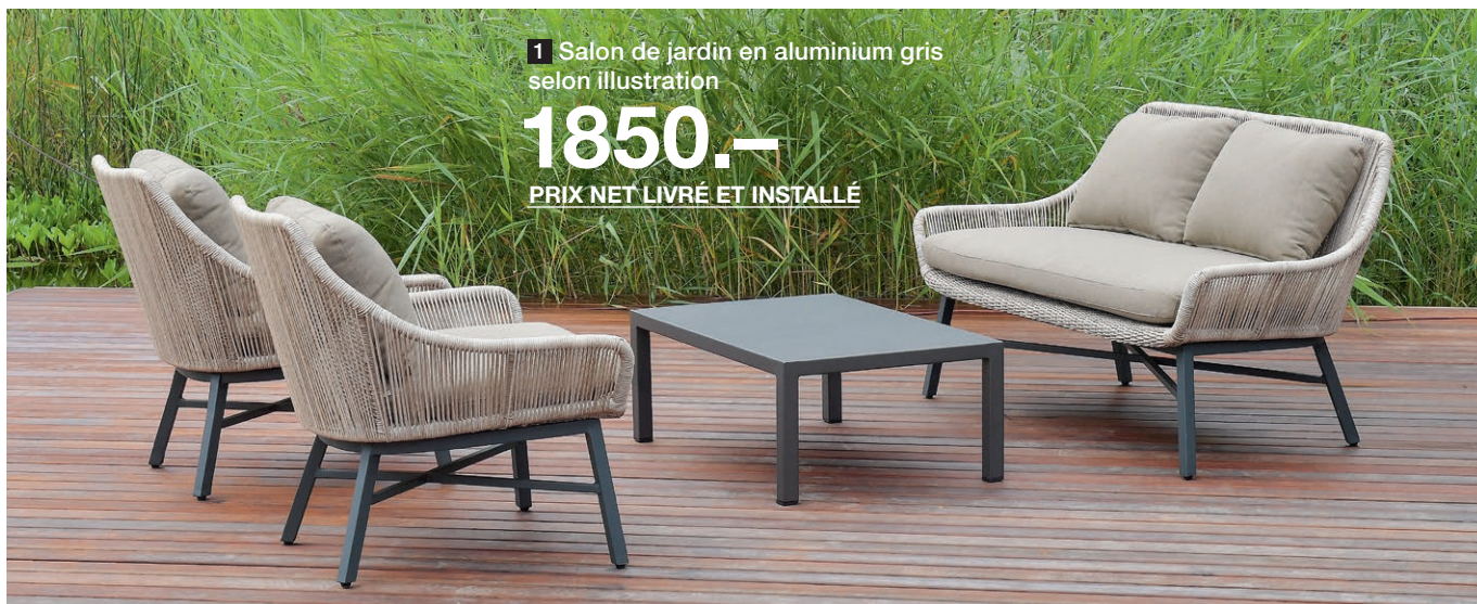
1 Salon de jardin en aluminium gris selon illustration