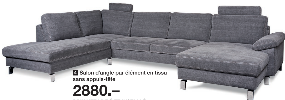
4 Salon d'angle par élément en tissu sans appuis-tête